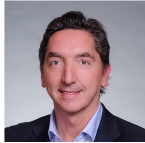
إيفان تورانوس الرئيس والمدير التنفيذي

تشرح مدونة قواعد السلوك المهني والأخلاقيات (المُشار إليها في ما يلي باسم المدونة) الخاصة بشركة Zimmer Biomet المعايير المتوقعة من أعضاء الفريق في كل سوق وعلى جميع المستويات. ندرك أنّ الالتزام بهذه المعايير والالتزام بالمدونة ليس بالأمر السهل